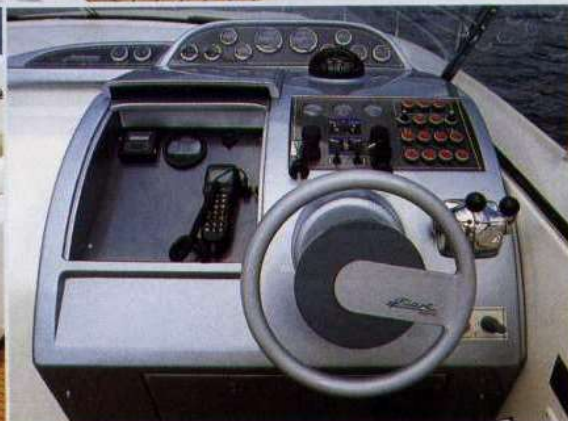
A sinistra, la base della seduta di guida è stata sfruttata per il ricovero della cuscineria prendisole. Sopra, il cruscotto è ergonomico e funzionale.